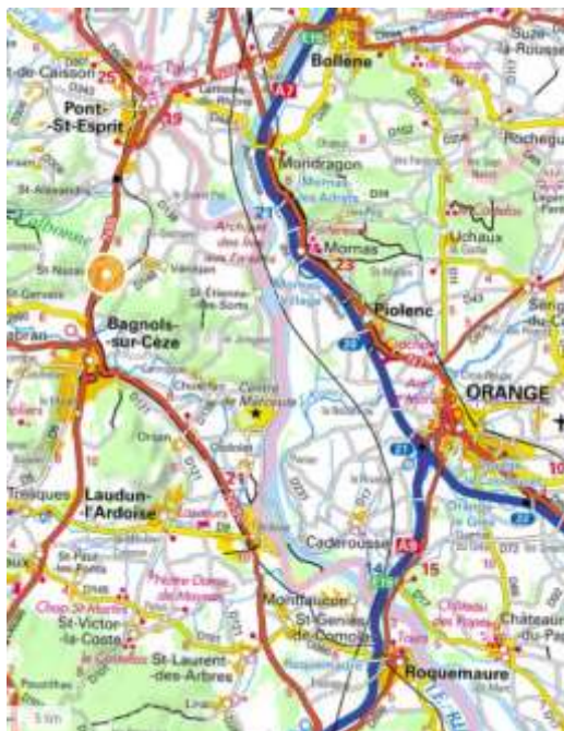
carte 1 : la commune de Saint-Nazaire au nord de Bagnols-sur-Cèze et le réseau routier